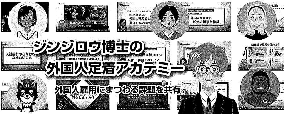
e-Learning教材「ジンジロウ博士の外国人定着アカデミー」

てきました。その研究成果を動画にまとめたのです。対象は、日本人の経営者、人事・法務・支援担当者、現場指導者の方たちです。内容は、「シ